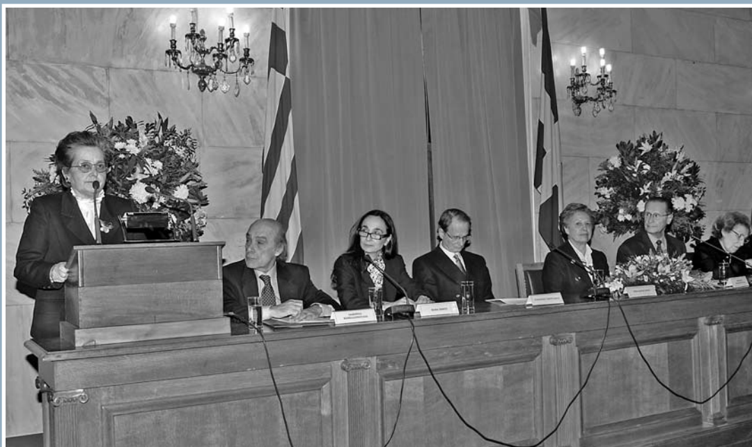
Στιγμιότυπο από την τελετή βράβευσης στην Παλαιά Βουλή

Στα πλαίσια αυτά το Κέντρο anthropos.gr καλλιέργησε συνεργασίες με άλλες εθελοντικές οργανώσεις. Χαρακτηριστικό παράδειγμα, η τριήμερη πολύπολιτισμική εκδήλωση «Πολιτισμός των Ανθρώπων», που πραγματοποίησε με επιτυχία, πριν δύο μήνες, με τη συμμετοχή και άλλων πολύ γνωστών οργανώσεων και του Δήμου Αμαρουσίου. Το κυριότερο όμως έργο του Κέντρου αποτελεί η δημιουργία της διαδικτυακής