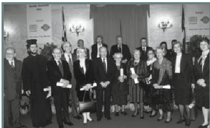
Στην Παλαιά Βουλή, ο Πρόεδρος της Δημοκρατίας κ.Κωστής Στεφανόπουλος με εκπροσώπους των βραβευθεισών ομάδων και τα Μέλη της Ελλανόδικης Επιτροπής