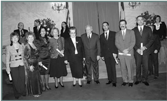
Στην Παλαιά Βουλή, ο Πρόεδρος της Δημοκρατίας κ. Κάρολος Παπούλιας με εκπροσώπους των βραβευθεισών ομάδων

Θεόδωρος Παπαλεξόπουλος , Πρόεδρος Κίνησης Πολιτών για μια Ανοικτή Κοινωνία