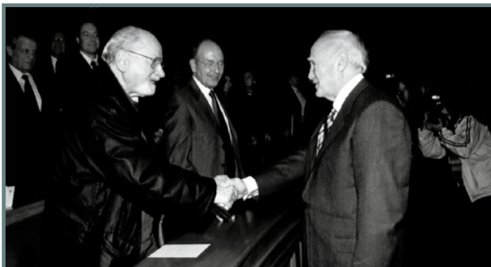
Παλαιά Βουλή, Νησιδες Ποιότητας 2005