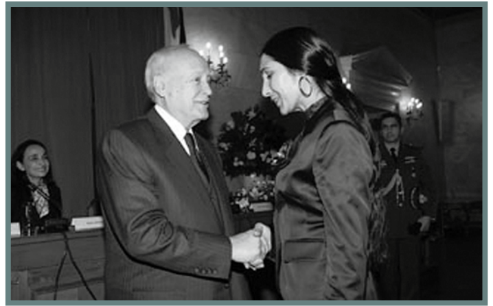
Απονομή επαινού από τον Πρόεδρο της Δημοκρατίας

Η Επιτροπή ανακήρυξε νικήτριες του Διαγωνισμού οκτώ (8) οργανώσεις που είναι: