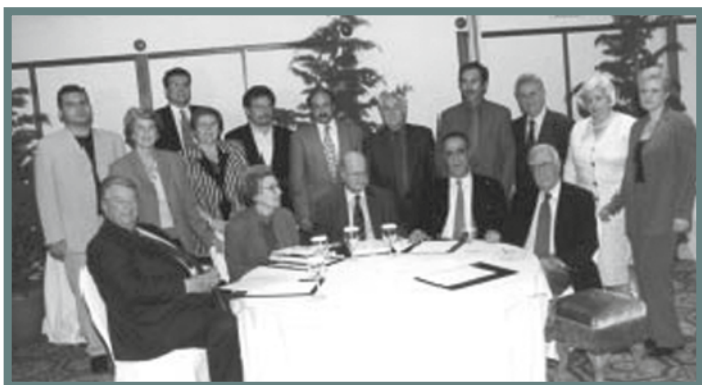
Τα μέλη της Επιτροπής με εκπροσώπους των βραβευθεισών ομάδων

Η Επιτροπή ανακήρυξε ως νικήτριες έντεκα (11) οργανώσεις: